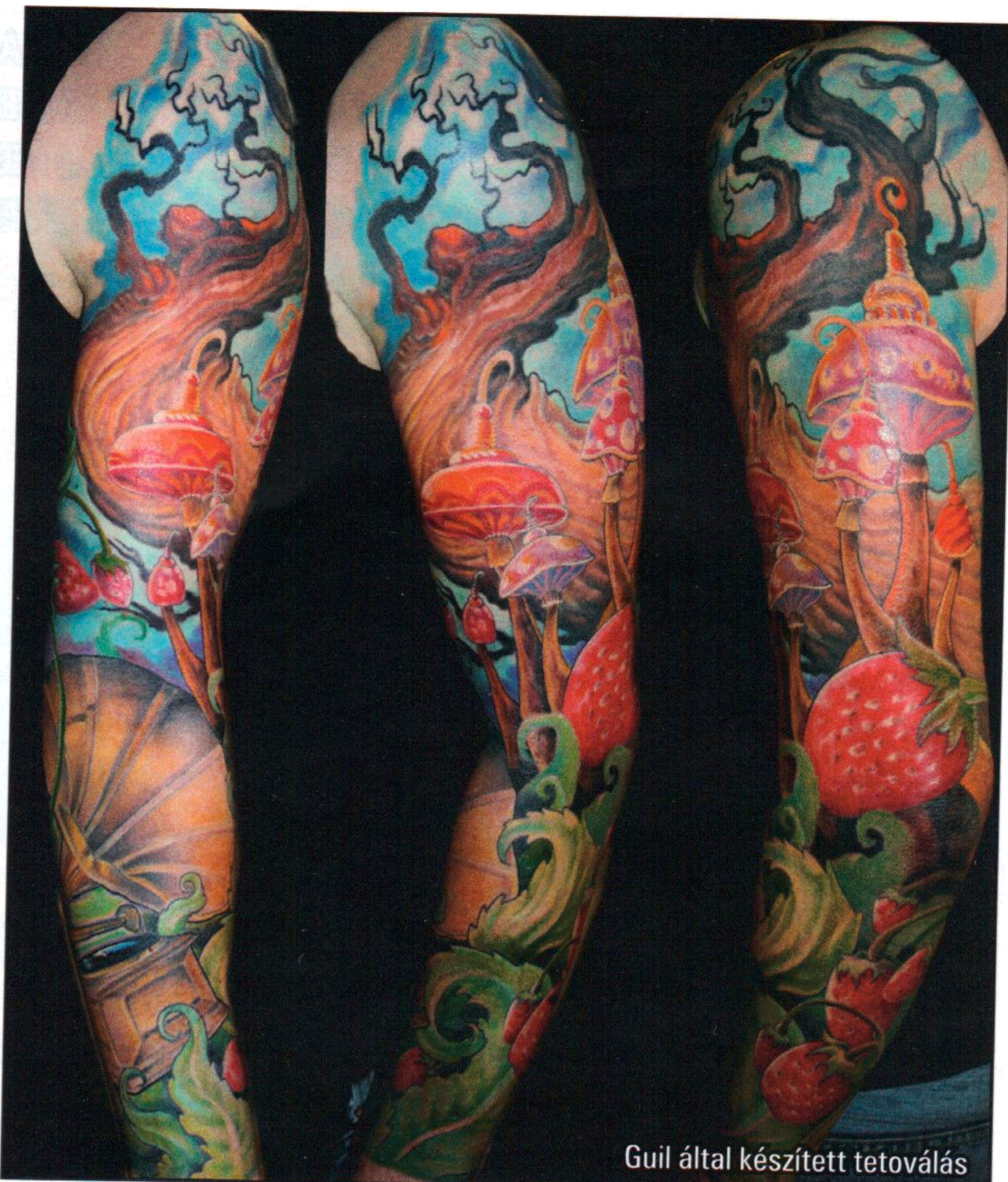
Guil által készített tetoválás