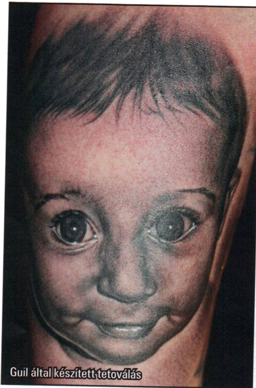
Guil által készített tetoválás